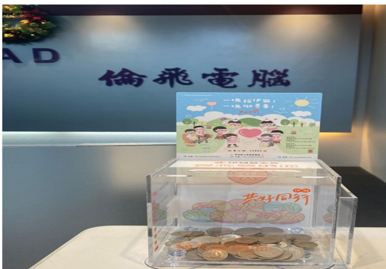
設於公司大門口的零錢捐助箱